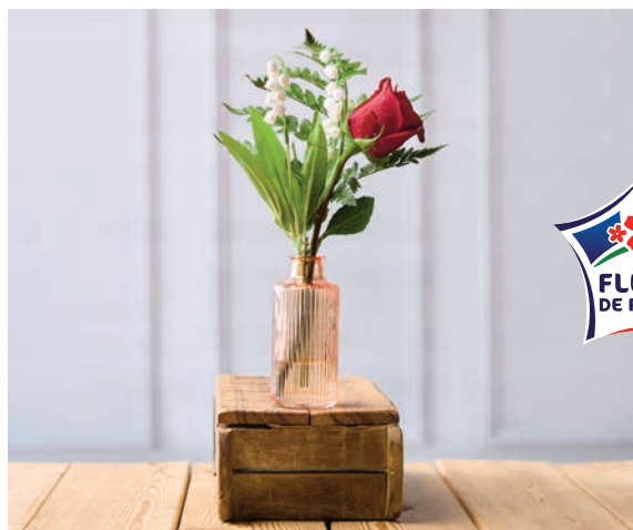
COMPOSITION MUGUET 3 BRINS + 1 FLEUR Hauteur : 35 cm Diamètre pot : 5 cm Avec vase en verre 4€ 59 LE VASE