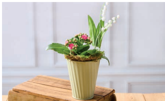
COMPOSITION 2 PLANTES Muguet 2 griffes + 1 kalanchoe Hauteur : 35 cm Diamètre pot : 11 cm Pot en zinc 7€ 99 LA COMPOSITION