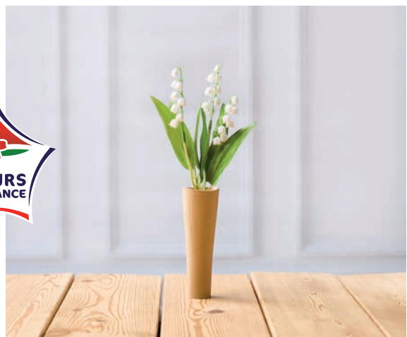
MUGUET 3 BRINS + 1 FEUILLE Hauteur : 25 cm Diamètre pot : 4 cm Pot biosourcé 2€ 99 LE POT