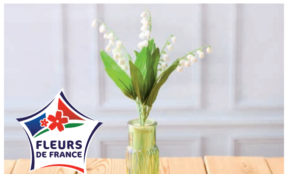
MUGUET 5 BRINS + FEUILLE Hauteur : 35 cm Diamètre pot : 5 cm Vase en verre déco 5€ 49 LE VASE

32 (A) Selon jour d'ouverture de votre magasin.